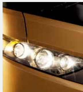
Conjunto óptico innovador en LED's