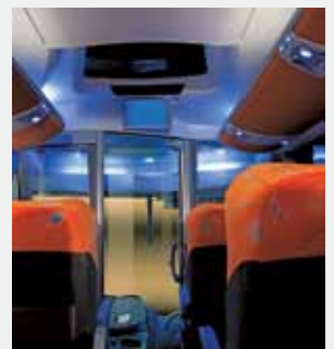
Nuevo ambiente interno más amplio, proporcionando mayor bienestar

¡Nosotros tenemos la solución adecuada para sus requerimientos!